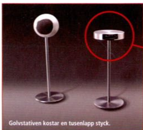
Golvstativen kostar en tusenlapp styck.