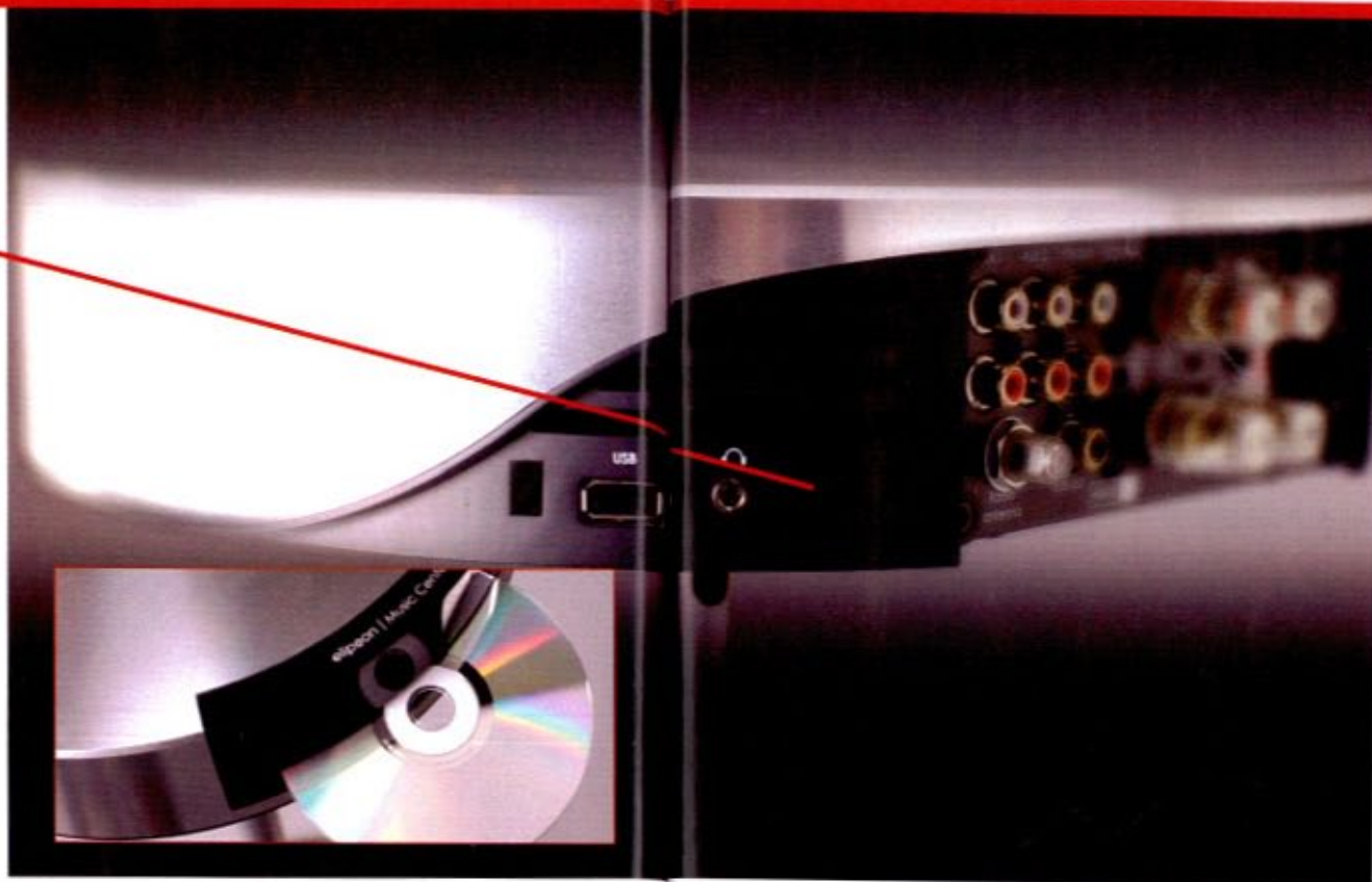
CD-spelare, FM, DAB+ och alla kontakter man behöver.

larna är ihåliga så att kablarna kan dras igenom dem och blir osynliga.